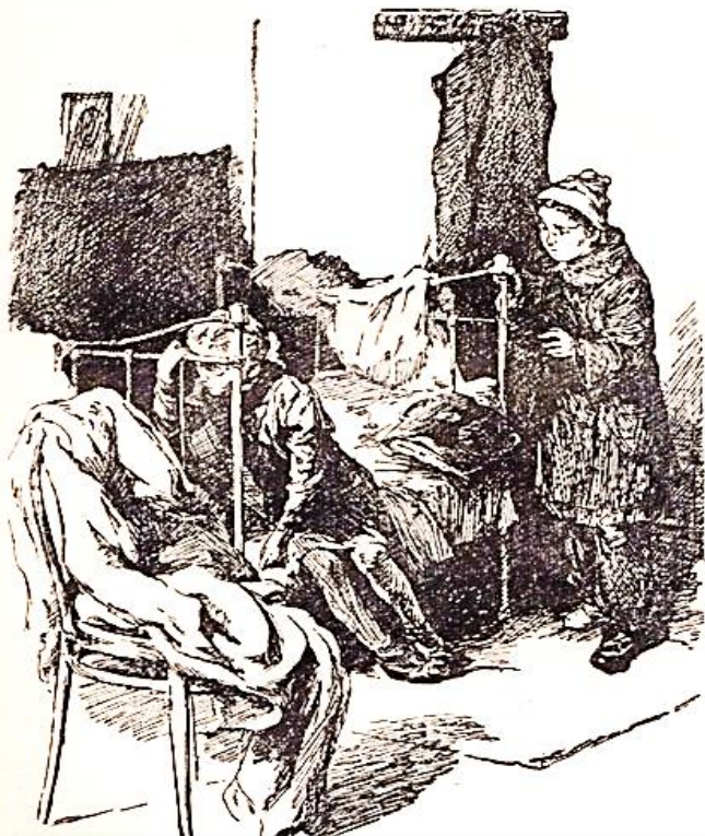
Зина в печали на кровати и Фатьма

Проходит какое-то время и в семье Стрешнёвых происходит страшное – умирает мама Зины. Все погружаются в отчаяние и не знают, что делать. Всё хозяйство теперь ложится на плечики 11-летней девочки. Это очень тяжёлое бремя. И, хотя одноклассницы и соседки помогают ей, она по-прежнему загружена и даже из пятёрочки превратилась в троечницу.