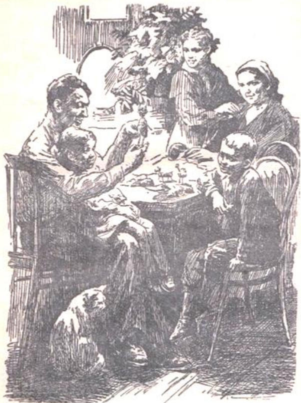
Вся семья Зины

Одна из примечательных её повестей – «Старшая сестра». Главной героиней книги является Зина Стрешнёва. Это наивная, но добрая и умная девочка, которая рано лишилась любимой мамы, в результате чего ей пришлось повзрослеть и найти в себе силы одной заботиться о семье и доме.