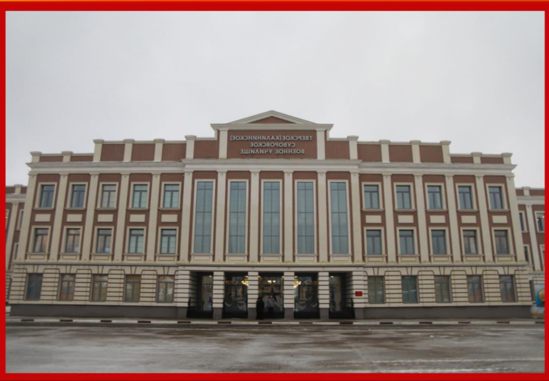
Современное Тверское Суворовское военное Ордена Почёта училище (ТвСВУ)