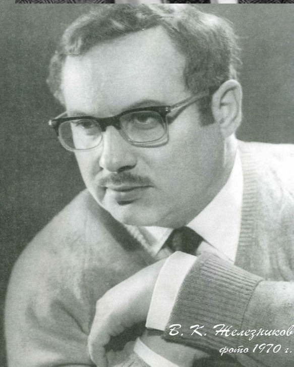
В. К. Железников фото 1970 г.

Владимир Железников родился 26 октября 1925 года в городе Витебск. Отец служил в пограничных войсках, и семье приходилось часто переезжать. Будущему писателю это давало возможность постоянно общаться с новыми людьми. Мальчик с детства хотел стать военным, поэтому во время Великой Отечественной войны решил последовать примеру отца и поступил в артиллерийское училище, которое окончил с отличием. Во время войны он вёл дневниковые записи, писал очерки военных будней. В 1945 г., сразу после войны, Владимир Железников продолжал заниматься литературой. Через некоторое время он решил получить соответствующее образование и поступил в Литературный институт им. М. Горького, который успешно окончил в 1957 г.