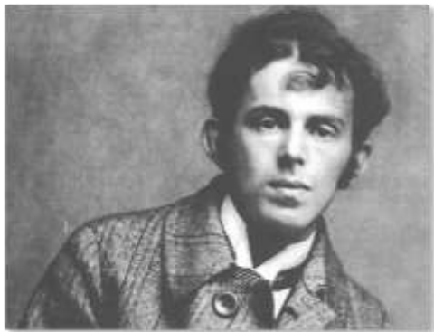
Август 1914 года

Последним же пристанищем поэта перед арестом стал