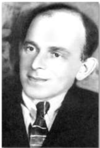
Около 1925 года

На выставке в областной библиотеке имени Горького пред-