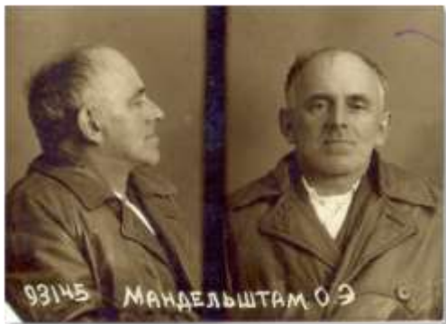
Осип Мандельштам. Фотография из следственного дела. 1938 год

При всем том тверскую главу своих “Воспоминаний”