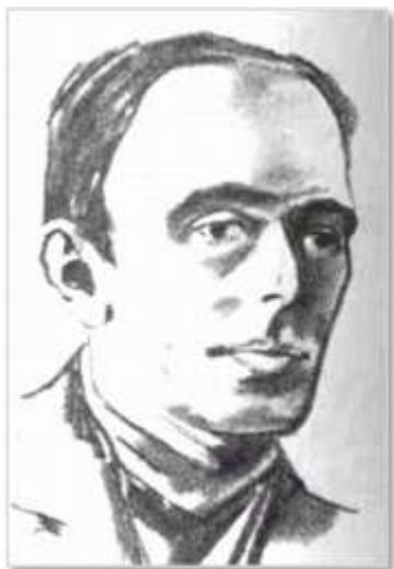
Портрет О. Мандельштама работы С. Галлербаха. 1923 г.

Так уж случилось, что последнее “свободное”, т.е. до второго ареста время своей жизни поэт связал с городом Калинин. Зимой 37-38-го годов супруги Мандельштамы провели в нашем городе. Почему здесь? Пожалуй, случайность. Один хороший человек посоветовал, другой помог найти комнату. А они сами после