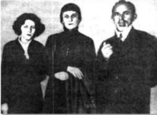
Мария Петровых, Анна Ахматова, Осип Мандельштам. Нащокинский переулок февраль 1934 года

Мы вскоре заметили своеобразную черту наших хозяев —