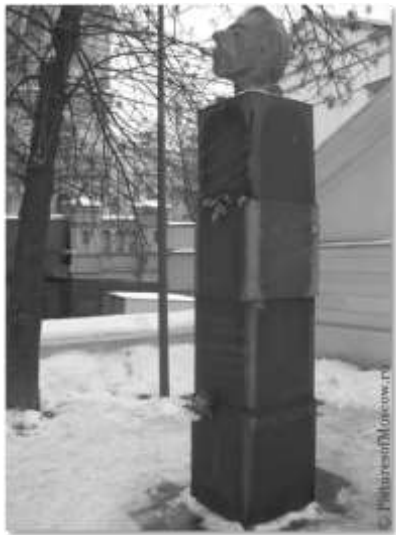
Памятник в Москве