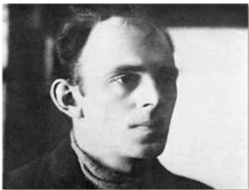
Осип Мандельштам Москва. 1923год, любимое фото Надежды Яковлевны Мандельштам

Моментальный арест, ссылка в Воронеж, скитание по разным городам и неприметным поселкам в надежде затеряться, скрыться от ненасытной мести “кремлевского горца” уместились в четыре тревожных года. И вот показалось, что уязвленное самолюбие диктатора