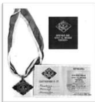
Почетный знак «Крест св. Михаила Тверского»