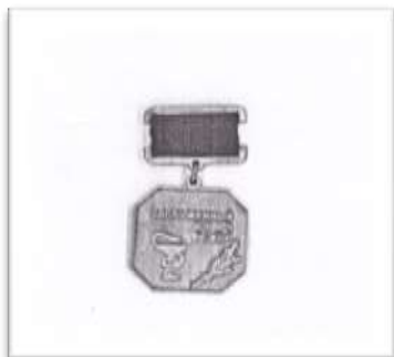
Знак «Заслуженный врач РСФСР»