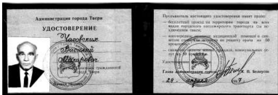
Удостоверение Почетного гражданина города Твери