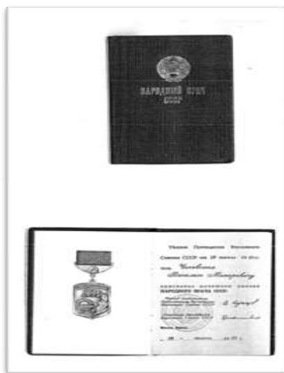
Почетное звание «Народный врач СССР»