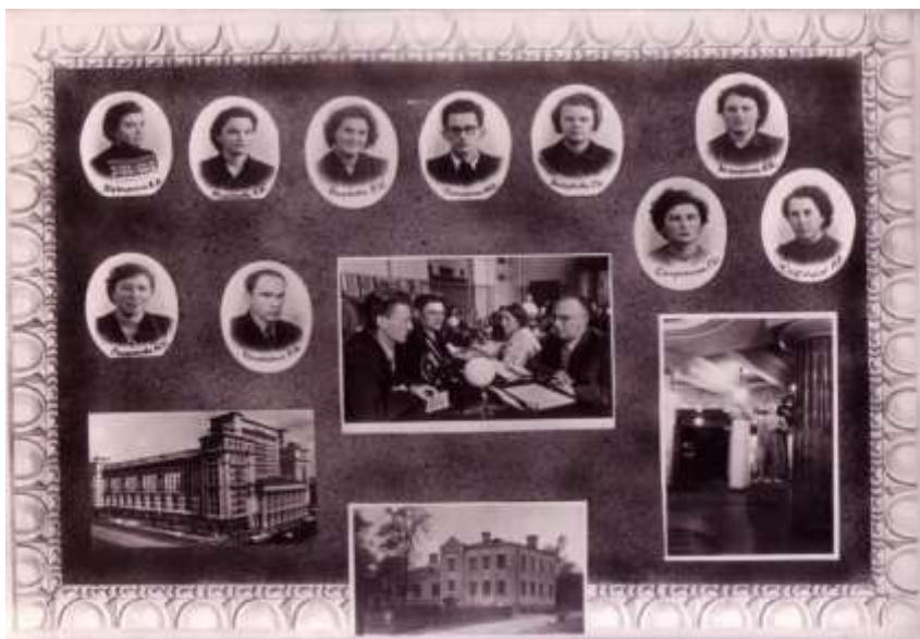
2-й Московский Государственный медицинский институт им. И.В. Сталина. Выпускной курс (1956 г.)