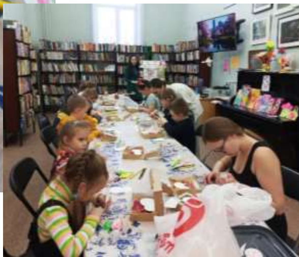
Мастер-класс по росписи имбирных пряников