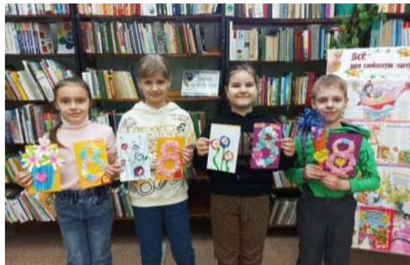
«Подарочки для любимой мамочки!» мастер-класс по изготовлению открытки