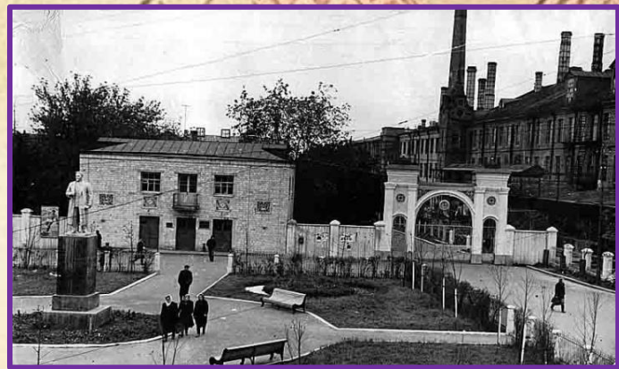
Конаковский фаянсовый завод им. М.И. Калинина, г. Конаково

Одним из ярких воспоминаний будущего художника были россыпи разноцветных фаянсовых сколов из завода, с которыми играла местная детвора. Эти впечатления повлияли на его будущее увлечение керамикой и декоративно-прикладным искусством.