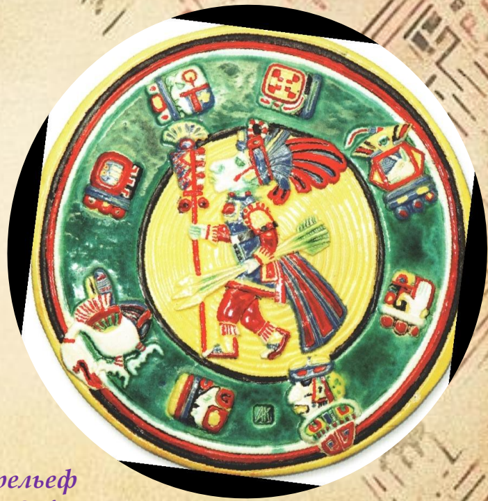
Декоративный рельеф интерьера «Mon-Café» (2005-2007)

Кроме сети кафе «Mon-Café», он занимался оформлением тверских ресторанов «Фортуна», «Люблин».