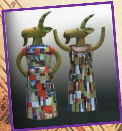
«Тверские козы» (2007)

Простодушную непосредственность, характерную для народного искусства, демонстрируют «Тверские козы», наряженные в сарафаны. Художник не раз обращался в своём творчестве к символам тверской геральдики и делал много росписей с изображениями древних памятников и достопримечательностей Твери и её окрестностей.