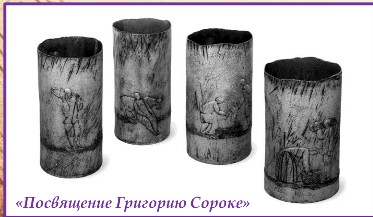
«Посвящение Григорию Сороке»