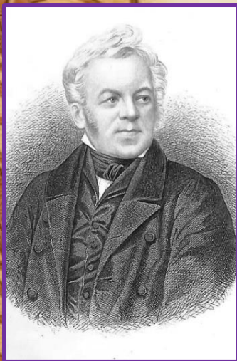
И.И. Лажечников (1792-1869), писатель