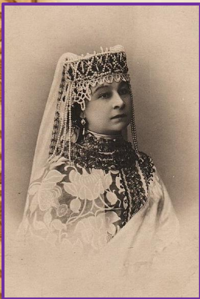
М.Н. Ермолова (1853-1928), русская актриса