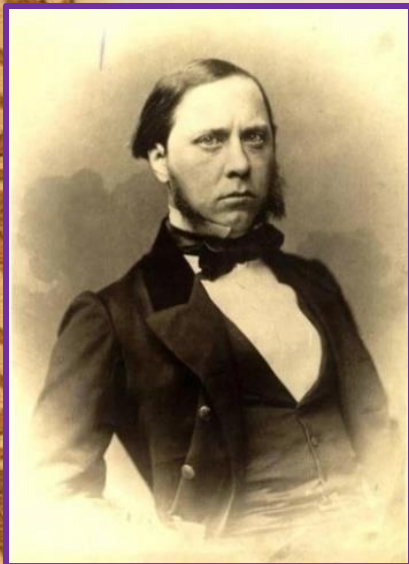
М.Е. Салтыков-Щедрин (1826-1889), писатель

О селе Воскресенском писал писатель М.Е. Салтыков-Щедрин: «В нашем, сравнительно угрюмом, Калязинском уезде прорывались веселые центры, в особенности в селе Воскресенском, где жило до семи помещичьих семей, которые, несмотря на скудные средства, ничем другим не занимались, кроме хлебосольства».