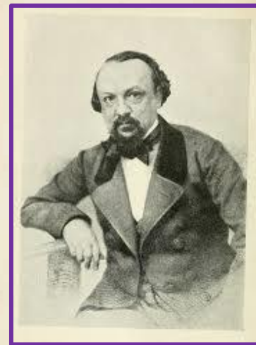
Алексей Феофилактович Писемский (1821- 1881), писатель