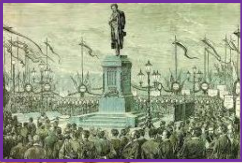
Памятник А.С. Пушкину